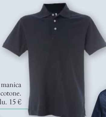
Polo a manica corta 100% cotone. Colore blu. 15 €